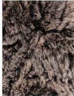
2 Marrone chiaro Melange