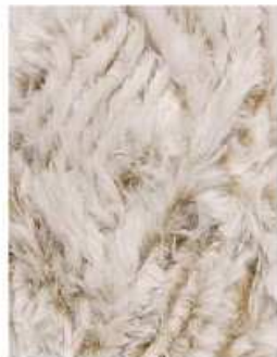
6 Beige Melange