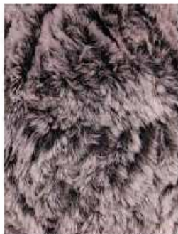
5 Marrone Melange