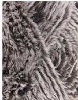
4 Tortora Melange