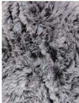
3 Grigio Melange