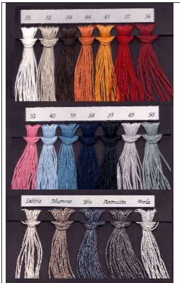
170181 49017 RILOGA MULTITASCA 7cm 3 fili (50) Riloga multitasca in poliestere 100% altezza 7cm, tre fili, confezione in rotoli da 50 metri