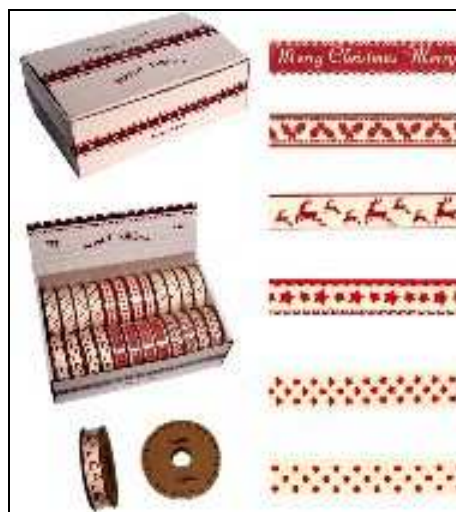
37.1083 ASPS6 ASSORTIMENT O DI NASTRI NATALE 24r Assortimento di nastri fantasie natalizie; 24 rotoli da tre metri in un comodo box di cartone.