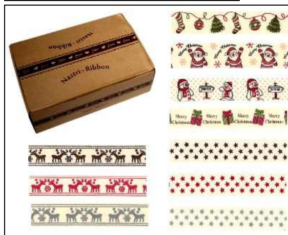
37.1085 ASPS12 BOX ASSORT.NASTRI NATALE 24 ROT. Assortimento di nastri con fantasie natalizie; 24 rotoli da tre metri in un comodo box di cartone