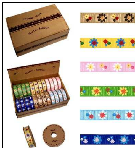
37.1084 ASPS7 ASSORTIMENT O NASTRI FIORI 24r Assortimento di nastri di cotone, 24 rotoli tre per disegno (fantasie a fiori). Disponibili in comodo box di cartone.