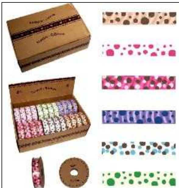
37.1082 ASPS8 ASSORTIMENTO NASTRI POIS 24r Assortimento di nastri di cotone (fantasie a pois): 24 rotoli da tre metri. Disponibili in un comodo box di cartone.