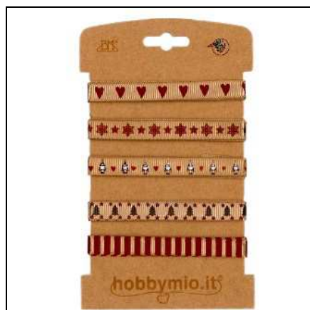
37.1086 ASPS100 ASSORT.PASSAM ANERIE x12 BLISTER Assortimento di passamanerie 100% poliestere; confezione in busta con 12 blister da 5 nastri da 1 metro