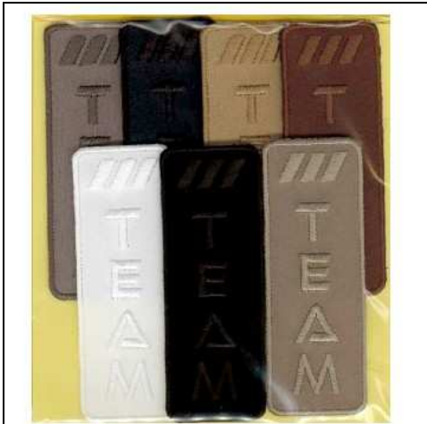
249008 APPLICAZIONI I RICAMATE MA9008 (7) Applicazione ricamata termoadesiva, dimensioni 25x70mm