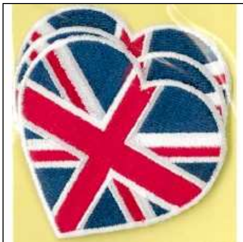
249202 APPLICAZIONI I RICAMATE TH MA9202 (3) Applicazione termoadesiva ricamata, dimensioni 60x60mm