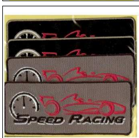
249091 APPLICAZIONI I RICAMATE MA9091 (4) Applicazione ricamata termoadesiva, dimensioni 40x97mm