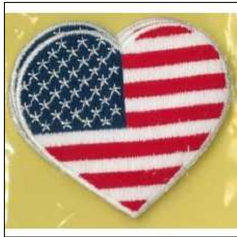
2490201 APPLICAZIONI I RICAMATE MA9201 (3) Applicazione ricamata termoadesiva, dimensioni 60x60mm