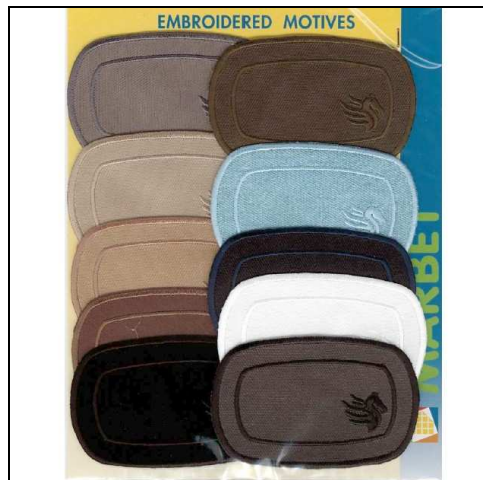
249128 APPLICAZIONI I RICAMATE MA9128 (10) Applicazione ricamata termoadesiva dimensioni 80x50mm