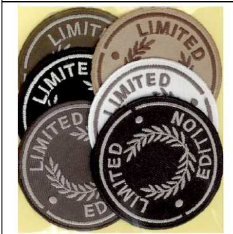
2490174 APPLICAZIONI I RICAMATE MA9174 (6) Applicazione ricamata termoadesiva, dimensioni 60mm