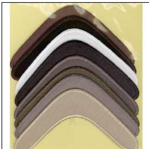
249176 APPLICAZIONI I RICAMATE MA9176 (8) Applicazione ricamata termoadesiva dimensioni 85x40mm

walther@scuolanazionaledimerceria.it , telefonicamente 0547-384634, via fax 0547 632199. Nel caso si superasse il numero massimo di sei iscritti il corso potrà svolgersi in due turni in date da stabilirsi.