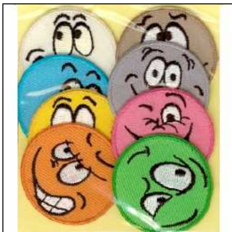
249133 APPLICAZIONI I RICAMATE TH MA9133 (8) Applicazione ricamata termoadesiva, dimensioni 35mm