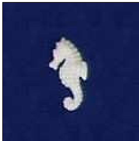
802919 POLIS CAVALLUCCI O MARINO (10)