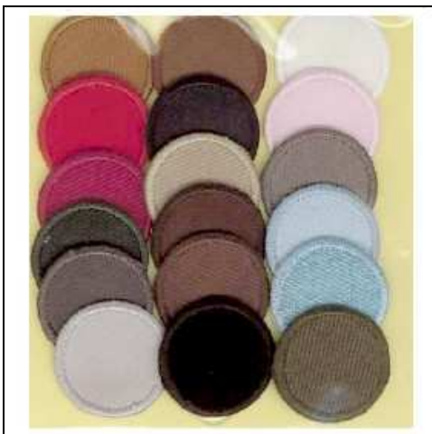
2490175 APPLICAZIONI I RICAMATE MA9175 (18) Applicazione ricamata termoadesiva, dimensioni 21x21mm