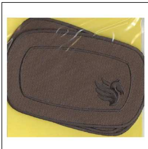
249130 APPLICAZIONI I RICAMATE MA9130 (3) Applicazioni ricamate termoadesive, dimensioni 70x115mm, disponibile nei colori: beige, grigio, nero e blu