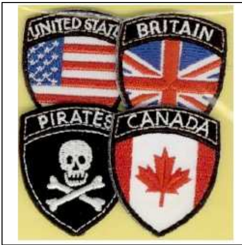
248962 APPLICAZIONI I RICAMATE TH MA8962 (4) Applicazioni ricamate termoadesive, dimensioni 34x40mm