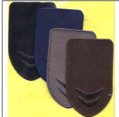
249074 APPLICAZIONI I RICAMATE MA9074 (12) Applicazione ricamata su tessuto termoadesivo, confezione in blister con istruzioni per l'uso con 4 pezzi di colori diversi, dimensioni 40x70mm