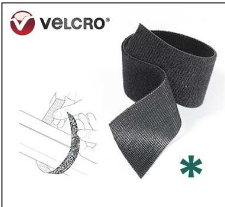
960214W VELCRO AUSONIA 20mm ONE-WRAP (25) Velcro h. 20mm double face, con uncino e asola contrapposti, disponibile nero in scatola da 25 metri. VELCRO® Brand One-Wrap ® è perfetto per l'organizzazione di fili, cavi e cavi e per impacchettare

una vasta gamma di materiali e strumenti progettato per uso interno o esterno è riutilizzabile e forte.