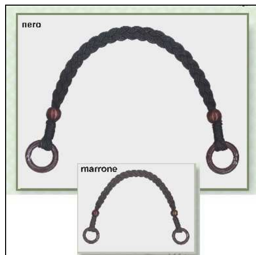
615143 ML043 MANICO BORSA IN CORDA C/PERLE+A NEL Manico per borsa in corda intrecciata arricchito di perle e olive in legno, dimensioni 86cm, disponibile a fronte ordine nei col. Bblu,

fuxia, verde e rosso, confezione in busta self service.