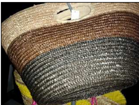
3232676 BORSA PAGLIA SECCHIELLO 50X23xH30 Borsa secchiello in paglia e tessuto disponibile bicolore verde e marrone.