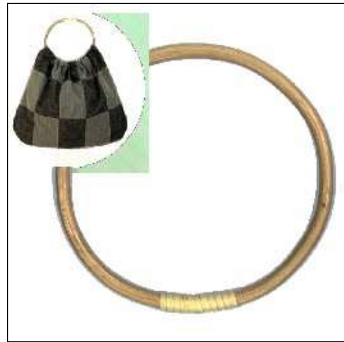
615032 ML032.20 MANICO DI LEGNO PER BORSA PAIO Manico legno per borsa diametro 20cm.