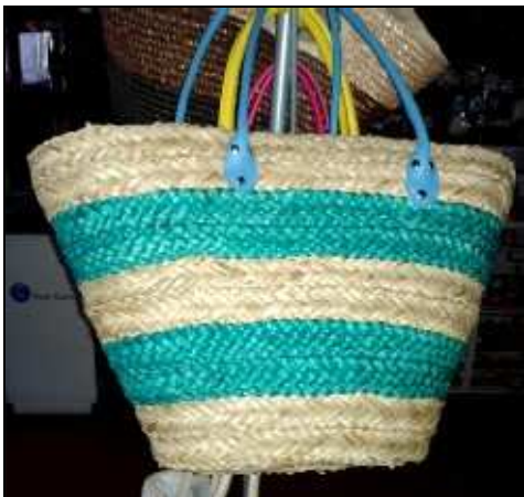
3232675 BORSA PORTALV. PAGLIA/TESS UTO 50x18xH32 Portalavoro borsa in paglia e tessuto disponibile nei colori, rigato turchese e rigato giallo.

3232674 BORSA MAIS RETTANG.FODERATA GRANDE Portalavoro borsa in mais foderata in tessuto, tasca interna con zip, colore naturale. €9,8166