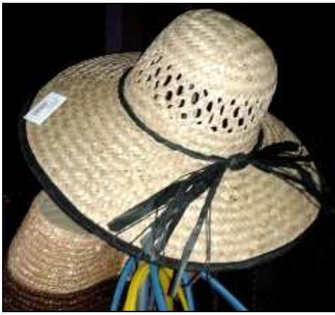
3232671 CAPPELO DONNA TESA LARGA NERO Cappello donna tesa larga con fiocco di paglia nero