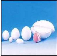
80242 POLIS UOVA h080x55mm (22) Uova in polistitolo espanso pieno, confezione in sacchetti da 22 pezzi.