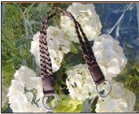
616100 MA116 MANICO BORSA PELLE INTRECC. 1pz Manico di pelle intrecciata con anelli nichel, lunghezza cm. 49 disponibili nero e marrone.