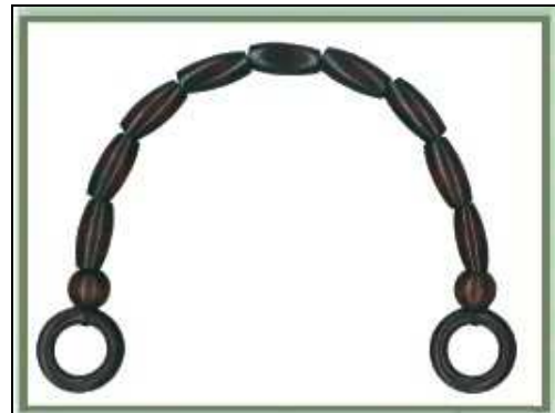
615135 ML035 MANICO DI LEGNO PER BORSA UN PAIO Manico per borsa in corda e perle di legno colore naturale, dimensioni 360mm