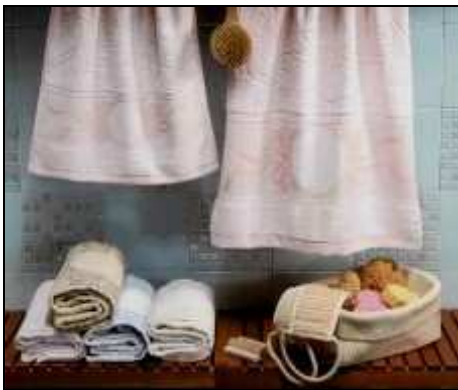
S105 CORREDO COPPIETTA SPUGNA 60x110+40x60 Coppietta spugna jacquard con ovale aida a 55 fori. Composizione cotone 100%, misure: l'asciugamano 60x110cm, l'ospite 40x60 cm. Varianti: naturale,

una vasta gamma di materiali e strumenti progettato per uso interno o esterno è riutilizzabile e forte.