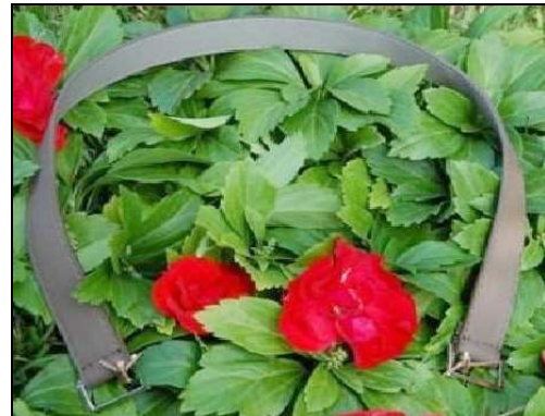
615110 MA149 MANICO BORSA PELLE LISCIO 1pz Manico per borsa in pelle liscio con fibbie in metallo disponibile nero.