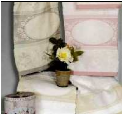
S12 RETE COPPIETTA SPUGNA 40x60+60x110 Coppia ospite 40x60 e asciugamano 70x120cm in puro cotone doppio ritorto jacquard con medaglione aida e orlo a giorno, varianti bianco, celeste, rosa e naturale, consegna a fronte ordine in 5/7 gg.

rosa, celeste. Nella variante naturale la composizione è misto lino (ordito in lino, trama in cotone naturale). Confezione in busta trasparente. Consegna a fronte ordine in 5/7 gg.