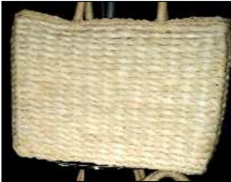
3232672 BORSA MAIS RETTANG.FO DERATA PICCOLA Portalavoro borsa in mais foderata in tessuto, tasca interna con zip, colore naturale.

3232673 BORSA MAIS RETTANG.FODERATA MEDIA Portalavoro borsa in mais foderata in tessuto, tasca interna con zip, colore naturale. €9,1102